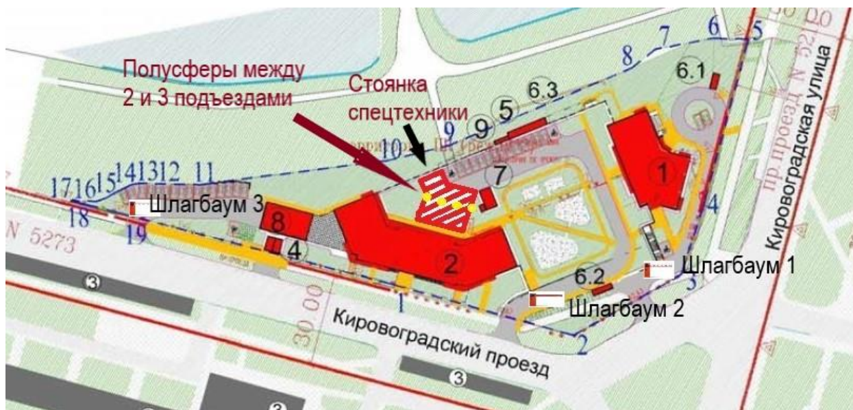
Схема размещения МАФ, шлагбаума стоянки специальной техники

Шлагбаум устанавливается согласно схеме в месте, обозначенном «Шлагбаум 3»